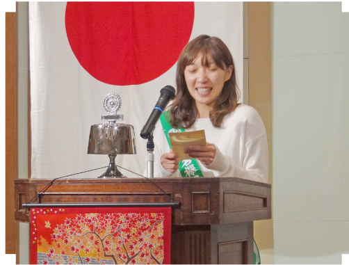
海老名樺 RC 奨学生挨拶