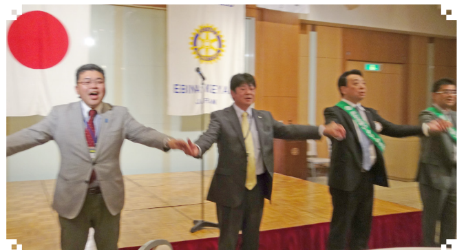
手に手をつないで