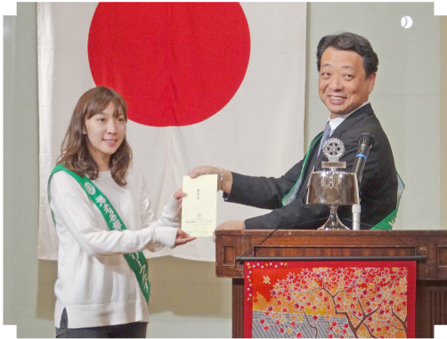
海老名樺 RC 奨学金授与