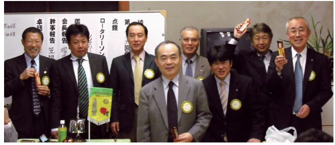
1月・2月皆出席の皆様